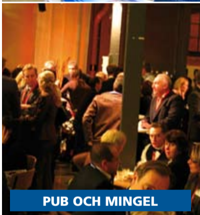
PUB OCH MINGEL

Gör årets bästa – och billigaste – investering onsdagen den 19 februari! Boka snabbt en av de sista platserna som utställare på Nacka FöretagarTräffs 20-årsjubileum! Eller ta åtminstone med dina närmaste medarbetare och besök FöretagarTräffen på NackaStrandsMässan och kom tillbaka med ovärderliga nya kontakter, nya affärer och massor av nya idéer.