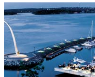
Alla utställare och besökare har chans att vinna en brunch för två på Restaurant J.